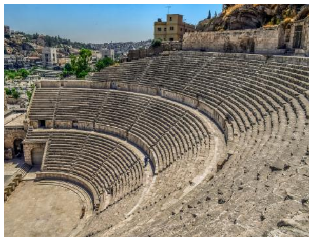
Amman, Amfiteatrul Roman

"Citadela" se află pe cea mai înaltă colină din Amman (850 metri deasupra mării) și este înconjurată de un zid lung de 1700 m. Nu departe de Citadelă, se află Amfiteatrul Roman, care datează din vremea Imperiului Roman, pe când Amman era cunoscut ca Philadelphia. Aflată în centrul orașului, cea mai veche moschee Al-Husseini, a fost construită în stil otoman în 1924 de către Abdullah al Iordaniei.